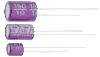
スリーブ色：パープル

SSシリーズは、SC・SA・SLシリーズを小型化したものです。 SW電源等をさらに小型化するのに適しています。